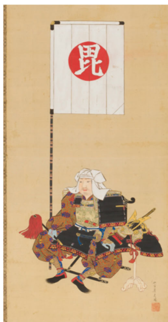
住吉広定筆「上杉謙信像」(部分)