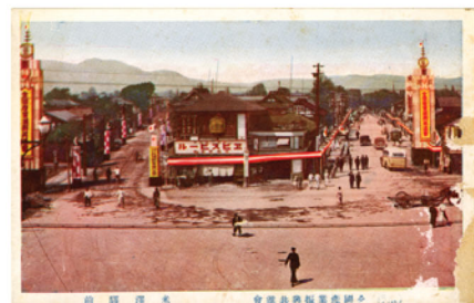
全国産業振興共進会 米沢駅前 絵葉書