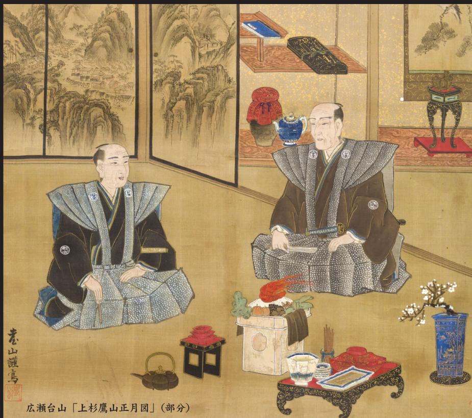
広瀬台山「上杉鷹山正月図」(部分)