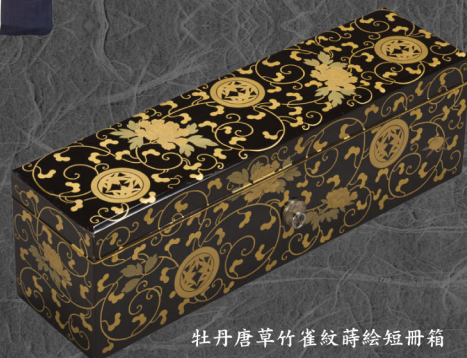
牡丹唐草竹雀紋蒔絵短冊箱