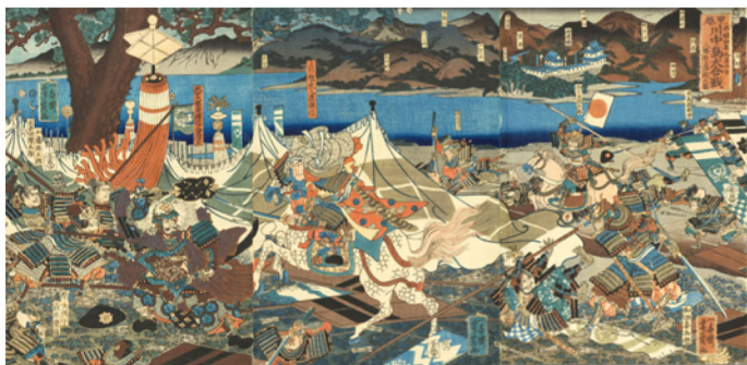
歌川芳員「甲越川中島大合戦」(部分)