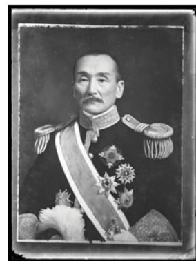
平田東助肖像写真ガラス乾板